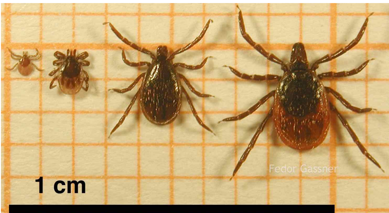
De meest algemene teek in Nederland: de schapenteek Ixodes ricinus . Van links naar rechts: larve, nimf, volwassen mannetje en volwassen vrouwtje.

Ook zijn er enorm veel beestjes die erg op een teek lijken, denk aan de larven van lieveheersbeestjes, kleine spinnetjes, zogenaamde springstaartjes, mijten, bladluizen en ga zo maar door. De meeste van deze beestjes zijn onschuldig. Een eenvoudige manier om te checken of het om een teek gaat is door te proberen het beestje plat te drukken: bij teken (en vlooiën) lukt dit bijna niet! Kijk naar de onderstaande foto om de teek te herkennen. Maak je je echt zorgen? Stuur dan de vermeende teek op ter identificatie bij het KAD [ http://www.kad.nl/nl/diensten/onderzoek/determinatie ].