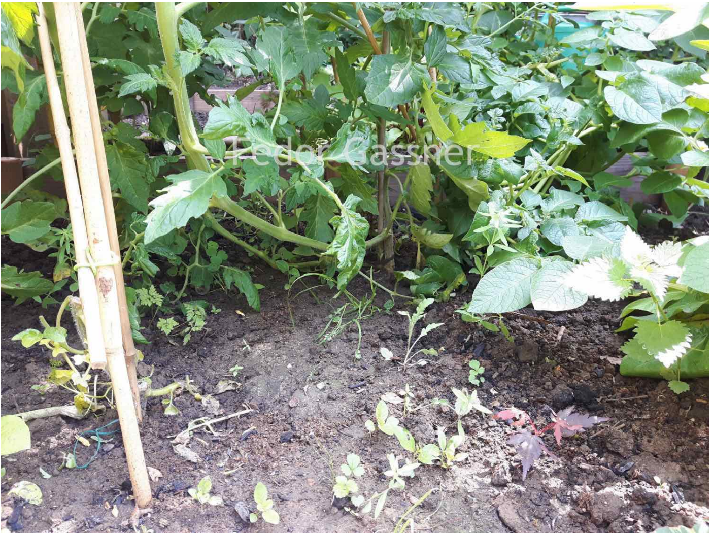
Op de kale regelmatig bewerkte aarde van de groentetuin voelen teken zich niet thuis.